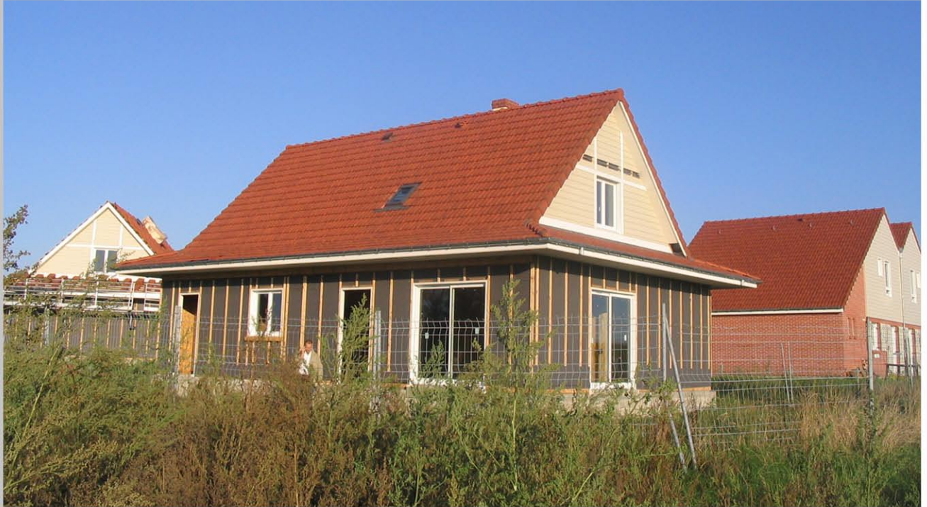
MAISON A OSSATURE BOIS