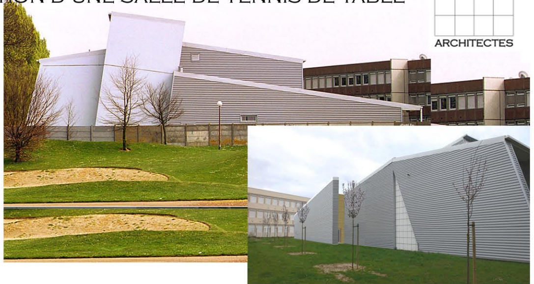
Un mur d'escalade créé à l'extérieur la dynamique du bâtiment

1 444 M 2 DE SHON EXTENSION 1 022 M 2 DE SHON